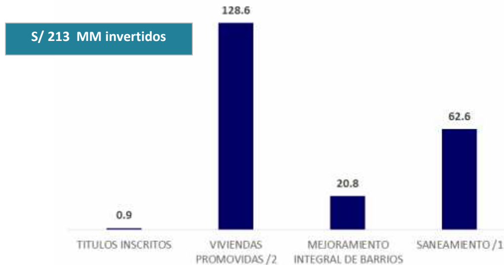
INVERSIÓN DEL MVCS SEGÚN PRINCIPALES PROGRAMAS, Agosto 2016 - Agosto 2017 (En millones de soles)

1/ Saneamiento : Incluye los programas de saneamiento urbano y rural