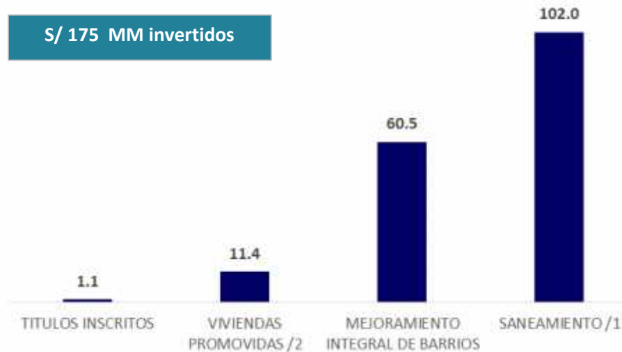
INVERSIÓN DEL MVCS SEGÚN PRINCIPALES PROGRAMAS, Agosto 2016 - Agosto 2017 (En millones de soles)

1/ Saneamiento : Incluye los programas de saneamiento urbano y rural